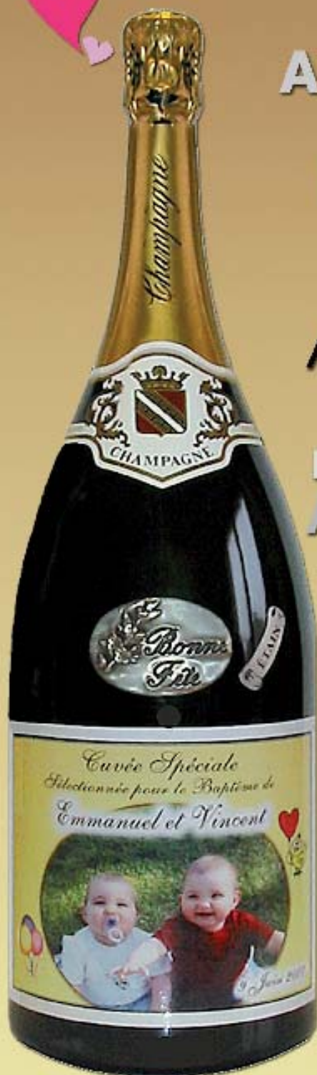
Magnum de Champagne 1,5 litre