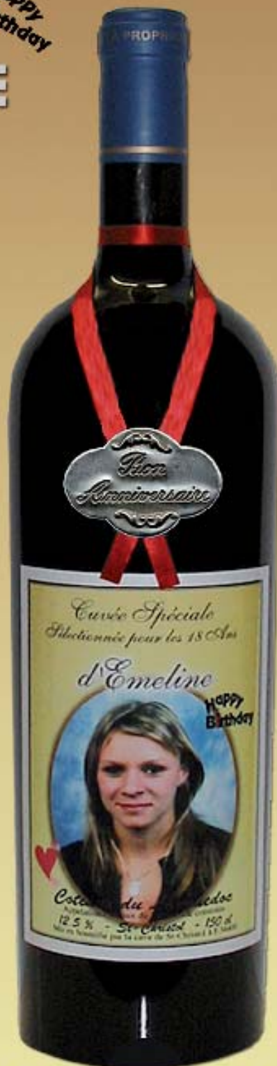
Magnum de Vin 1,5 litre